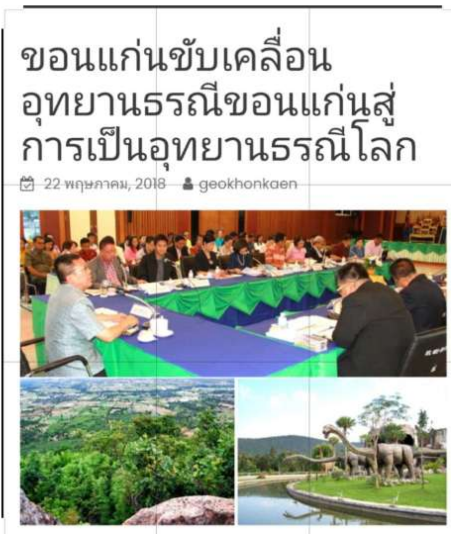
ภาพที่ 2.1.1 การประชุมขับเคลื่อนอุทยานธรณีขอนแก่นสู่ การเป็นอุทยานธรณีโลก

อนุรักษ์ทรัพยากรธรรมชาติผ่านการท่องเที่ยว การศึกษา และการสร้างเศรษฐกิจชุมชนส่งผลให้เกิดการพัฒนาพื้นที่อย่างยั่งยืนต่อไป ด้วยการผลักดันให้ขอนแก่นเป็นแหล่งธรณีโลกในประเทศไทยเป็นแห่งที่ 2 ต่อจากอุทยานธรณีโลกสตูล